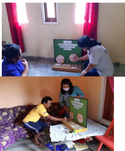
Gambar 6. Mempraktekkan alat peraga lingkaran kubik

beberapa contoh soal akar pangkat tiga dari suatu bilangan yang besar dengan menggunakan alat peraga lingkaran kubik. Selama menjelaskan dan memperagakan alat peraga lingkaran kubik, pemateri memberikan kesempatan kepada orang tua untuk bertanya. Setelah orang tua memahami, pemateri memberikan kesempatan kepada orang tua untuk menggunakan alat peraga lingkaran kubik dalam mengerjakan soal yang diberikan.