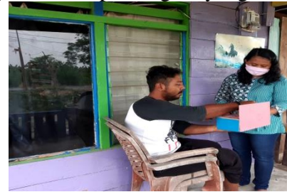
Gambar 5. Orang tua menggunakan alat peraga

alat peraga camplung. Selama penyampaian materi dan memperagakan alat peraga pameri memberikan kesempatan kepada orang tua untuk bertanya. Untuk memastikan apakah orang tua memahami materi dan dapat menggunakan alat peraga camplung, pameri meminta orang tua mengerjakan soal dengan menggunakan alat peraga camplung. Semua orang tua sudah memahami konsep pembagian, dimana pembagian adalah pengurangan berulang dan dapat menggunakan camplung dalam menjawab soal pembagian yang diberikan.