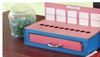
Gambar 1. Cangplung