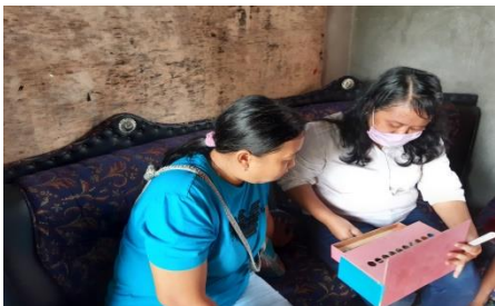
Gambar 4. Memperagakan alat peraga camplung

peraga camplung. Dalam mempelajari materi perkalian harus menguasai materi penjumlahan, untuk itu pameri sebelumnya memastikan apakah semua orang tua memahami materi penjumlahan. Semua orang tua memahami materi penjumlahan. Sebelum menggunakan alat peraga camplung, pameri bertanya “ 2 \times 3 = \dots ”, semua orang tua menjawab 2 \times 3 = 6 . Pameri selanjutnya bertanya arti dari “ 2 \times 3 = 2 + 2 + 2 atau 2 \times 3 = 3 + 3 ?”, sebanyak 14 orang yang menjawab salah. Pameri kemudian menjelaskan materi perkalian dan memberikan contoh dengan menggunakan camplung. Selama menyampaikan materi dan memperagakan alat peraga pameri memberikan kesempatan kepada orang tua untuk bertanya. Semua orang tua tau hasil perkalian, namun tidak memahami konsep perkalian, dimana perkalian merupakan penjumlahan berulang. Setelah orang tua memahami penggunaan alat peraga camplung, pameri memberikan soal, dimana orang tua mengerjakannya dengan menggunakan alat peraga. Semua orang tua dapat menggunakan alat peraga camplung dan menjawab soal dengan benar.