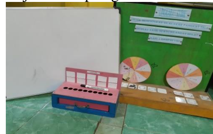
Gambar 3. alat peraga, spidol dan whiteboard

Kegiatan Pengabdian Kepada Masyarakat ini dilakukan kepada orang tua murid SDN Inpres 1 Arso 1. Dalam melakukan pembelajaran alat peraga dan tulis disiapkan.