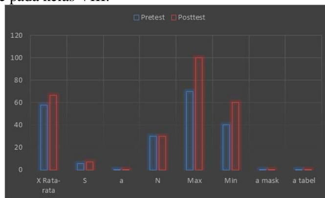
Gambar 1. Diagram Perbandingan Hasil Uji Normalitas Soal Pretest Dan Posttest Kelas Kontrol.

Uji normalitas mempunyai tujuan untuk mengetahui apakah data yang dianalisis berasal dari populasi berdistribusi normal atau tidak. Teknik uji yang digunakan adalah Kolmogorov Smirnov pada taraf signifikan 0,05 di kelas X SMAN I Patimpeng Kecamatan Patimpeng Kabupaten Bone pada kelas VIII.