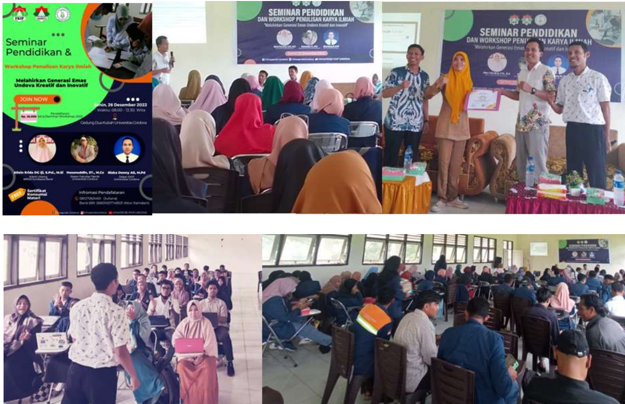
Gambar 3. Upaya Percepatan Penyusunan Skripsi Tahun 2022

Upaya percepatan penyusunan skripsi yang dilakukan oleh Unit Pengelola Program Studi (UPPS) diantaranya adalah mengadakan Seminar Pendidikan dan Kegiatan Workshop Penulisan Karya Ilmiah yang terakhir diadakan pada tanggal 26 Desember 2022. Selain itu telah dilakukan beberapa kali kegiatan serupa sebagai salah satu program tetap UPPS yang diadakan sejak tahun 2018. Adapun upaya lain yang dilakukan adalah memberikan kegiatan pendampingan dan pembimbingan kepada mahasiswa semester 7 yang sedang menyusun skripsi. Beberapa dokumentasi kegiatan yang dilakukan dapat dilihat pada gambar 4 di bawah ini.