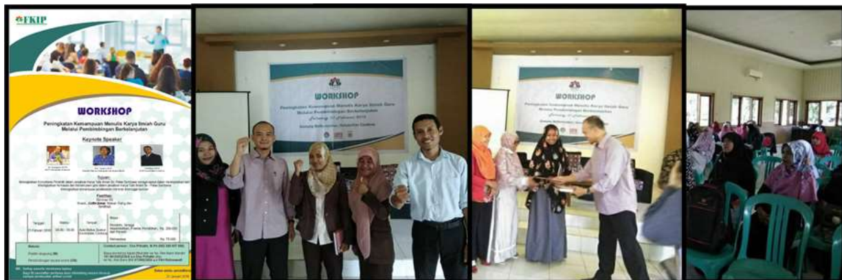
Gambar 4. Upaya Percepatan Penyusunan Skripsi Tahun 2018

Upaya percepatan penyusunan skripsi yang dilakukan oleh Unit Pengelola Program Studi (UPPS) diantaranya adalah mengadakan Seminar Pendidikan dan Kegiatan Workshop Penulisan Karya Ilmiah yang terakhir diadakan pada tanggal 26 Desember 2022. Selain itu telah dilakukan beberapa kali kegiatan serupa sebagai salah satu program tetap UPPS yang diadakan sejak tahun 2018. Adapun upaya lain yang dilakukan adalah memberikan kegiatan pendampingan dan pembimbingan kepada mahasiswa semester 7 yang sedang menyusun skripsi. Beberapa dokumentasi kegiatan yang dilakukan dapat dilihat pada gambar 4 di bawah ini.