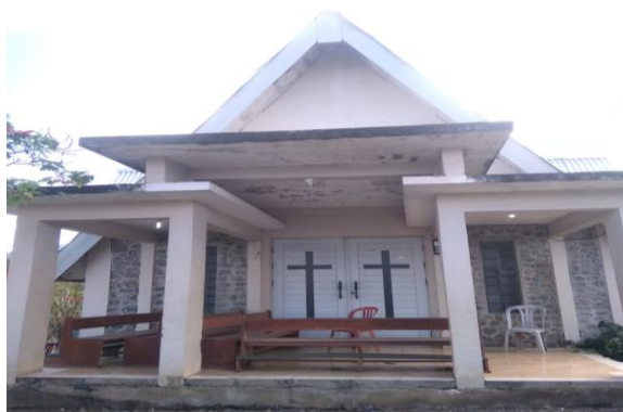
Gambar 2. Gereja Katolik Santo Petrus Masyarakat Donggo