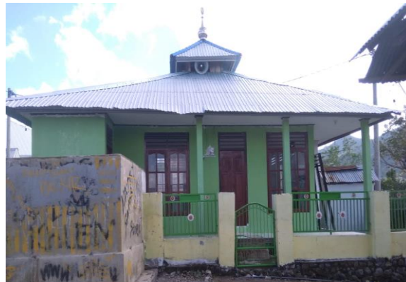
Gambar 1. Masjid Ar- Rahman Masyarakat Donggo