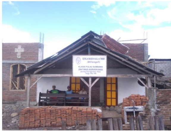
Gambar 3. Gereja Protestan Gemit Immanuel Masyarakat Donggo