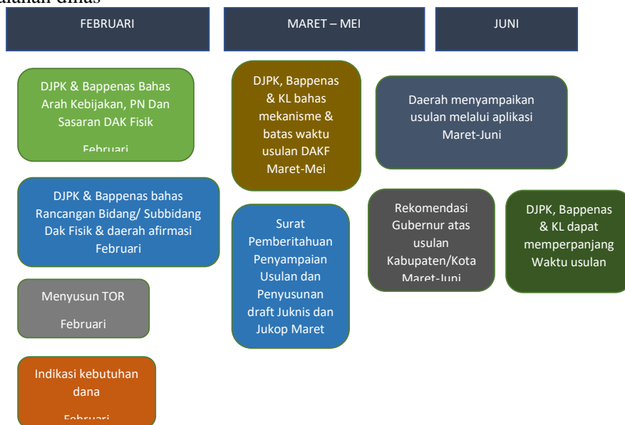
Gambar 1 : diolah dari djpk.kemenkeu.go.id “Perencanaan Proses perencanaan dan penganggaran DAK 2020.

Program yang menjadi prioritas nasional dimuat dalam rencana kerja pemerintah tahun anggaran yang bersangkutan. Menteri teknis mengusulkan kegiatan khusus yang akan didanai dari DAK dan ditetapkan setelah berkoordinasi dengan Menteri Dalam Negeri, Menteri Keuangan dan Menteri Negara Perencanaan Pembangunan Nasional sesuai rencana kerja pemerintah. DAK tidak dapat digunakan untuk mendanai administrasi kegiatan, penyiapan kegiatan fisik, penelitian, pelatihan, dan perjalanan dinas