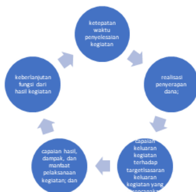
Gambar 4: diolah dari Pasal 13 Peraturan Presiden Republik Indonesia Nomor 123 Tahun 2020 Tentang Petunjuk Teknis Dana Alokasi Khusus Fisik Tahun Anggaran 2021.