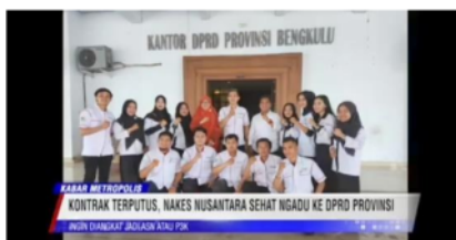
Gambar 6. Kesalahan Penulisan Berita 3

kejadian, waktu kejadian maupun penulisan data-data yang ada dalam berita tersebut. Pada berita ini terdapat kesalahan dalam penulisan judul beritanya. Selain itu kesalahan penulisan juga terdapat pada nama narasumber dan jabatan narasumber yang di wawancarai.