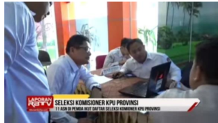
Gambar 4. Kesalahan Penulisan Berita 1

Berita yang tidak akurat yang tayang pada program Laporan Malam RBTB Bengkulu periode Februari 2023 adalah berita yang berjudul “Seleksi Komisioner KPU Provinsi, 11 ASN di Pemda Ikut Daftar Seleksi Komisioner KPU Provinsi”. Pada berita ini, berita yang ditayangkan menjadi tidak akurat karena masih terdapat kesalahan penulisan pada judul beritanya. kesalahan tersebut terdapat pada kata “Komioner” yang ada pada judul beritanya. Berikut adalah gambar yang terdapat kesalahan penulisan pada judul beritanya: