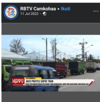
Gambar 1. Tampilan Program Laporan Malam RBTV Bengkulu

Berikut adalah contoh berita yang ditayangkan pada program Laporan Malam di RBTV dan program Kabar Metropolis di BETV :