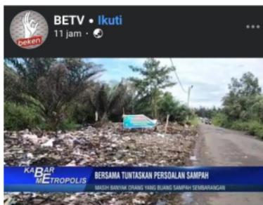
Gambar 2. Tampilan program Kabar Metropolis BETV Bengkulu

Gambar di atas adalah siaran berita pada 11 Juli 2022 oleh program berita Nightly Report RBTV. Berita ini terkesan tidak akurat karena masih ada item yang tidak diikuti dalam lima unsur akurasi survei Dewan Pers (2004). Salah satu contohnya adalah keakuratan gambar dengan isinya, gambar yang ditampilkan dalam berita selalu diulang-ulang sedemikian rupa sehingga tidak mendukung isi berita itu sendiri. Gambar program berita sangat mendukung isi berita, sehingga sangat membutuhkan banyak gambar yang berhubungan dengan isi berita, agar gambar yang ditampilkan dalam berita tidak mengulang gambar yang sama dan mendukung keakuratan berita.