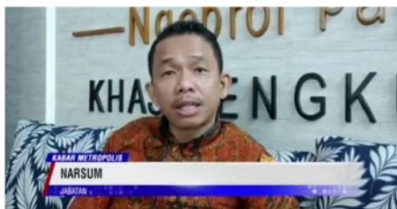
Gambar 6. Sumber Tidak Relevan

Pada pemberitaan ini, berita yang ditayangkan tidak akurat karena terdapat kesalahan dalam penulisan pada beritanya. Berdasarkan unsur akurasi berita kesalahan penulisan menurut penelitian Dewan Pers 2004 maka berita yang ditayangkan ini sudah akurat dan tidak terdapat kesalahan penulisan pada beritanya. Kesalahan penulisan bisa saja terdapat pada penulisan judul berita, nama narasumber, tempat kejadian, waktu kejadian maupun penulisan data-data yang ada dalam berita tersebut. Pada pemberitaan ini, terdapat kesalahan pada penulisan judul beritanya. kesalahan tersebut terdapat pada kata “Ngadu” yang seharusnya “Mengadu” karena dalam Kamus Besar Bahasa Indonesia (KBBI) tidak terdapat kata “Ngadu” melainkan “Mengadu”. Selain itu, menjadi tidak jelas sehingga berita ini juga tidak memenuhi unsur akurasi judul dengan isi berita. Dengan judul yang bertuliskan kata “Ngadu” tentunya tidak menggambarkan isi berita karena bahasa “Ngadu” tersebut bukan merupakan bahasa Indonesia yang baku dan tidak terdapat di dalam Kamus Besar Bahasa Indonesia (KBBI), sehingga berita yang ditayangkan menjadi tidak jelas karena tidak sesuai antara judul dengan isi berita tersebut.