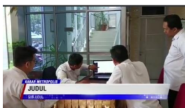
Gambar 5. Kesalahan Penulisan Berita 2

Berita pertama yang tidak akurat yang tayang program Kabar Metropolis di BETV Bengkulu adalah berita yang judulnya hanya bertuliskan “Judul, Sub Judul”. Pada berita ini, berita yang ditayangkan menjadi tidak akurat karena masih terdapat kesalahan penulisan pada judul beritanya. Berikut adalah gambar yang terdapat kesalahan penulisan pada judul beritanya: