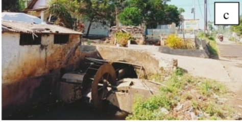
Gambar 4. Kondisi PLTMH PP. Nahdlatut Thalibin (a) Turbin 1; (b) Turbin 2; dan (c) Turbin 3

Berdasarkan sumber dari himpunan alumni PP. Nahdlatut Thalibin, tiap generator bisa menghasilkan energi listrik sebesar sekitar 3.000 watt. Jadi jika ditotal dari tiga generator tersebut dapat memasok energi listrik sekitar 9.000 watt. Pasokan energi listrik tersebut dapat dimanfaatkan untuk segala kebutuhan sehari-hari.