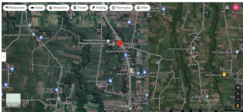
Gambar 1. Peta Lokasi PP. Nahdlatut Thalibin, Blado Wetan, Banyuwangi, Probolinggo

Keunikan yang ada di pondok pesantren Nahdlatut thalibin terlihat dari kemandirian pengadaan energi listrik. Energi listrik yang dimanfaatkan oleh pondok pesantren ini yaitu menggunakan Pembangkit Listrik Tenaga Mikrohidro (PLTMH), walaupun pasokan listrik dari PLN telah masuk ke daerah kecamatan Banyuwangi. Hal tersebut tetap dilanjutkan hingga saat ini agar dapat mempertahankan tradisi kemandirian pondok pesantren. Penggunaan energi terbarukan tersebut telah dilaksanakan sejak awal periode awal pondok didirikan.