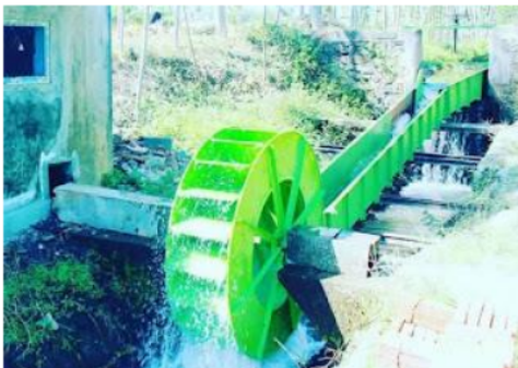
Gambar 3. Foto awal pembangunan PLTMH di PP. Nahdlatut Thalibin

https://www.damaruta.com/2019/05/pembangunan-kit-tenaga-listrik-mikrohidro.html