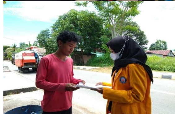
Gambar 4, 5 dan 6. Kegiatan Pembagian Leaflet

Cara dalam menyampaikan informasi untuk menambah pengetahuan merupakan faktor penting yang harus disesuaikan dengan kebutuhan masyarakat, sehingga pemilihan media dalam melakukan edukasi harus tepat. Media edukasi adalah bentuk sarana yang digunakan untuk menyampaikan informasi, baik dengan media cetak maupun dengan elektronik (Ramadhanti et al. , 2019). Keunggulan leaflet sebagai media edukasi adalah murah dan mudah dibagikan kepada masyarakat (Martiyana et al. , 2018).