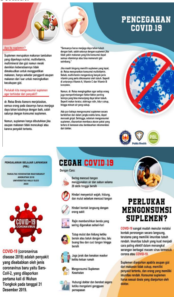
Gambar 2 dan 3. Media Leaflet yang digunakan pada edukasi konsumsi suplemen

Leaflet yang diberikan kepada masyarakat di Kelurahan Taha seperti berikut: