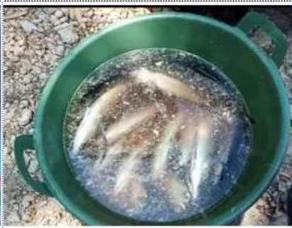
Gambar 8. Proses Perendaman Ikan