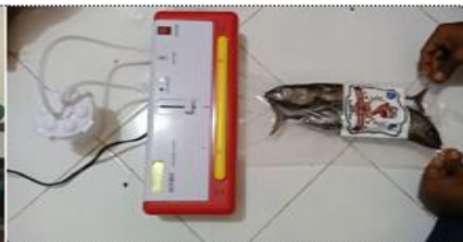
Gambar 14. Proses Pengemasan dengan Vacuum Sealer