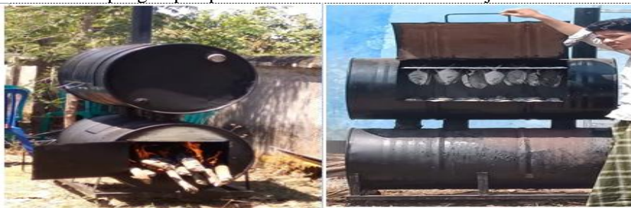
Gambar 11. Proses Pengasapan Ikan

Proses pengasapan dilakukan dengan menggunakan asap panas dari hasil pembakaran kayu dan batok kelapa pada tungku pengapian. Panas dan asap yang dihasilkan akan disalurkan melalui pipa-pipa penghubung yang menghubungkan antara dua drum/tong. Melalui pengasapan ini ikan yang berada di tong/ drum bagian atas lambat laun akan matang sehingga memperoleh warna dan rasa pengasapan yang khas. Proses pengasapan panas ini dilakukan selama 2 – 4 jam.