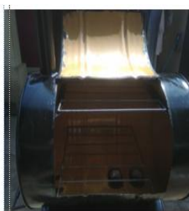
Gambar 3. Drum/tong bagian atas dan rak penggantung ikan (tempat pengasapan)

Sebagian besar material alat pengasapan ikan teknologi tepat guna” Po Patas” terdiri dari tong/drum. Dimana ruang tempat ikan diasap adalah pada drum bagian atas, sedangkan sebagai tungku pengapian pada drum/tong bagian bawah. Pada drum/tong bagian atas disusun dua rak untuk menggantung ikan. Rak penggantung terbuat dari besi yang dirangkai menjadi tujuh baris. Sedangkan pada drum/tong bagian bawah dibuat tempat pengapian dimana asap yang diperlukan untuk proses pengasapan disalurkan melalui pipa yang menghubungkan kedua drum/tong tersebut. Sementara pintu alat teknologi tepat guna” Po Patas” merupakan bagian dari tong/drum yang dipotong dan diberi engsel agar dapat dibuka dan ditutup. Untuk lebih jelasnya dapat dilihat dalam gambar berikut: