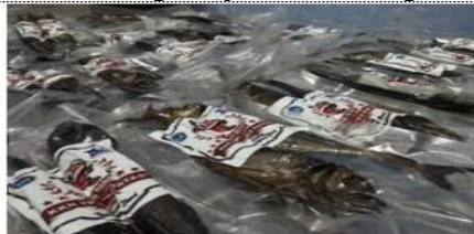
Gambar 15. Penyimpanan pada suhu normal

Tahap Penyimpanan dilakukan setelah seluruh produk ikan asap dikemas dengan vacuum sealer. Proses penyimpanan dapat dilakukan dengan menyimpan pada udara normal dan pada udara dingin. Penyimpanan pada suhu normal bias dilakukan dengan menyimpan di lemari makanan atau lemari penyimpanan. Sedangkan untuk penyimpanan dengan suhu dingin dilakukan di dalam lemari pendingin dengan suhu dibawah 0°C. Pada penyimpanan suhu normal ikan akan bertahan selama 2 minggu (14 hari). Sedangkan pada suhu dingin dibawah 0°C ikan asap bertahan hingga 3-4 bulan (120 hari).