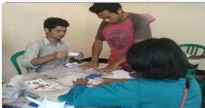
Gambar 13. Proses Pelabelan Pada Plastik Kemasan

Proses pengemasan dilakukan setelah ikan asap benar-benar dingin. Ikan asap dikemas dengan menggunakan plastic khusus yaitu plastic vacuum. Pengemasan ikan asap menggunakan teknik vacuum menggunakan alat vacuum sealer yaitu menghilangkan seluruh udara yang ada di dalam plastic sehingga ikan asap akan bertahan lebih lama dan terjaga kualitas rasa dan kebersihannya. Sebelum ikan asap dikemas dengan teknik vacuum, dilakukan pelabelan terlebih dahulu yaitu dengan menempelkan label pada plastic-plastic vacuum yang dipergunakan untuk pengemasan ikan asap.