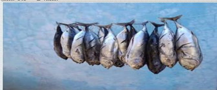
Gambar 9. Proses pengeringan ikan dengan digantung