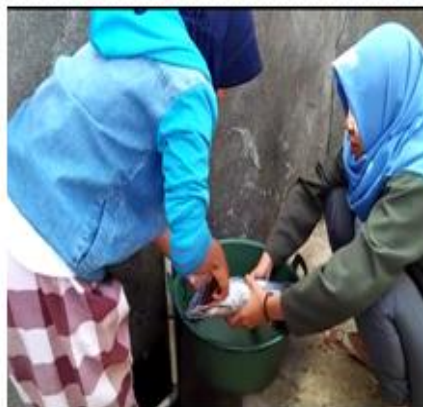
Gambar 6. Pengambilan isi perut dan insang