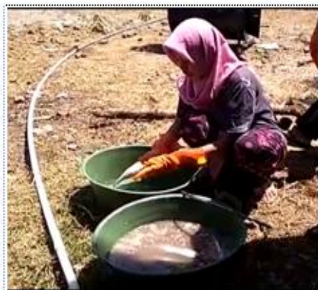
Gambar 5. Pencucian