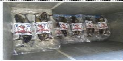
Gambar 16. Penyimpanan pada Freezer (Suhu di bawah 0°C)