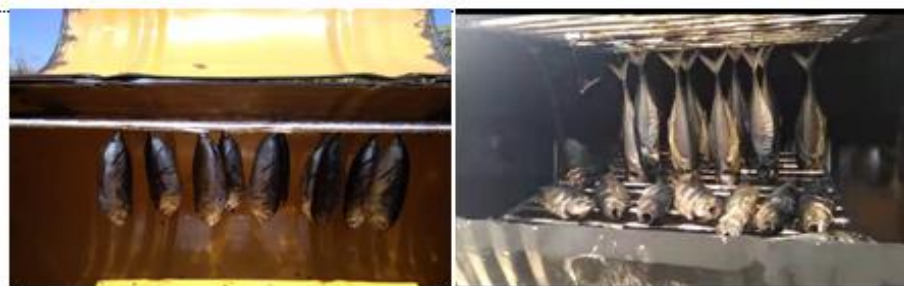
Gambar 10. Penataan ikan di mesin “Po Patas”