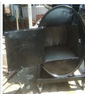
Gambar 4. Drum/tong bagian bawah (tempat pengapian)