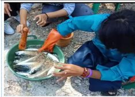
Gambar 7. Proses Pelumuran bumbu