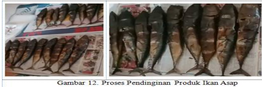
Gambar 12. Proses Pendinginan Produk Ikan Asap

Proses pendinginan setelah pengasapan dilakukan dengan menggantung atau menempatkan ikan hasil pengasapan pada Loyang-loyang. Proses pendinginan dilakukan sebelum proses pengemasan. Ikan harus dipastikan benar-benar dingin sebelum dikemas agar tidak ada uap dalam plastic pengemas. Proses pendinginan ini penting untuk menjaga kualitas ikan dan mempertahankan keawetan ikan asap.